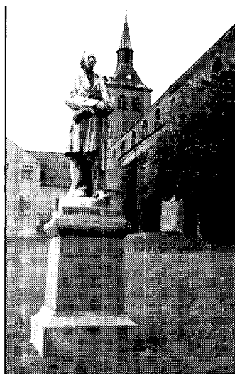
La statua di Andersen a Odense, sua città natale