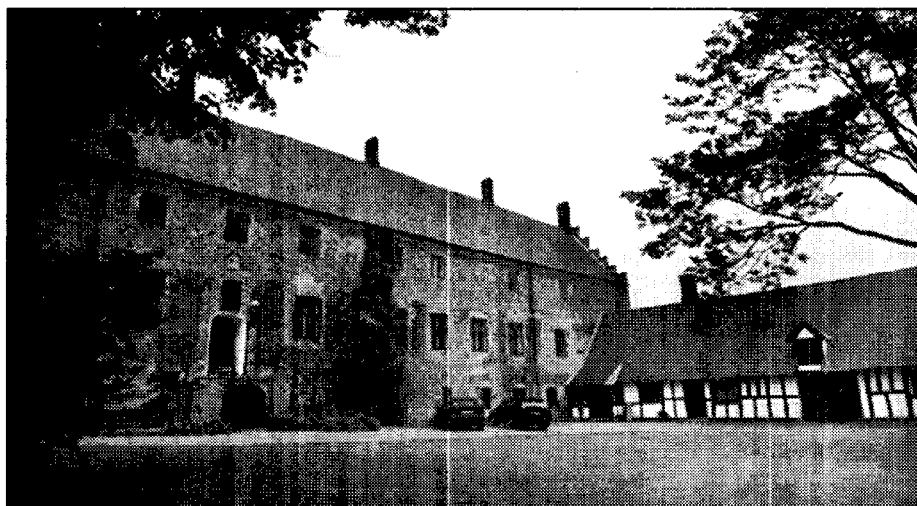
La sede della Fondazione «Hans Christian Andersen 2005» a Odense