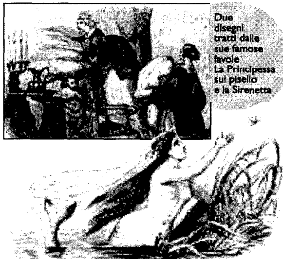
Due disegni tratti dalle sue famose favole La Principessa sul pisello e la Sirenetta