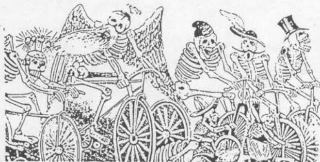
José Guadalupe Posada, «Ciclisti alla fine del XIX secolo»

Lars Gustafsson, «Morte di un apicoltore», trad. di Carmen Giorgetti Cima, Iperborea, pp. 181, lire 20.000.